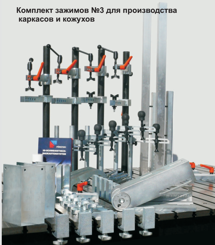
Комплект зажимов №3 для производства каркасов и кожухов