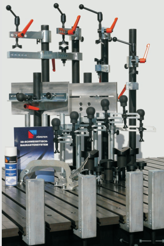
Комплект зажимов №2 для сваривания труб